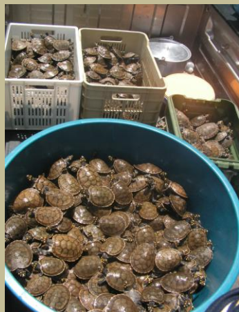
8 mil tortuguillos estrenaron hogar

Para el responsable de este proyecto ecológico, la liberación de los animales a su medio natural, por parte de niños, jóvenes y adultos de las comunidades es la mayor recompensa. Está convencido de que se trata de un trabajo a largo plazo, cuando surta efecto llevará a los involucrados a un uso consciente de estos recursos.