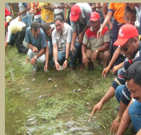
La población de Maripa crea conciencia ecológica